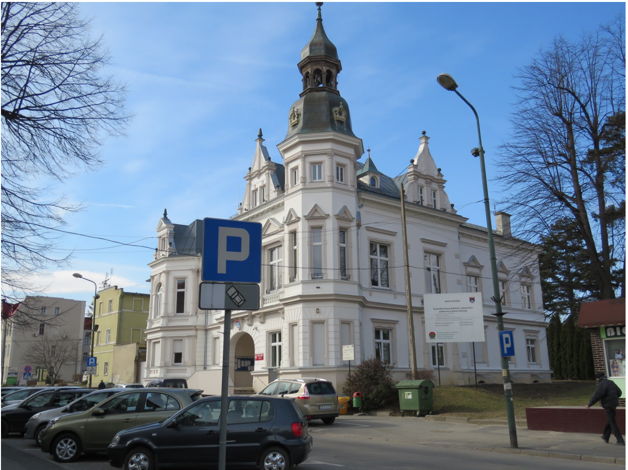
Tutaj jest główny budynek Urzędu, w którym pracują burmistrz i urzędnicy. Budynek ma jedno wejście główne od strony Placu Wolności 1.