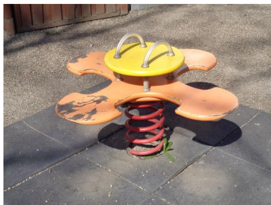
Fot. Proponowana forma stylistyczna elementów placu zabaw